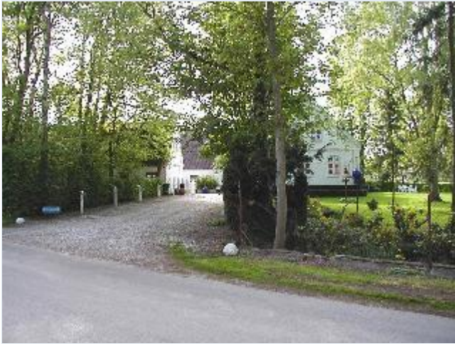
Foto: 5. Den store proprietærgård, Bårupgård, med parklignende have Stort billede