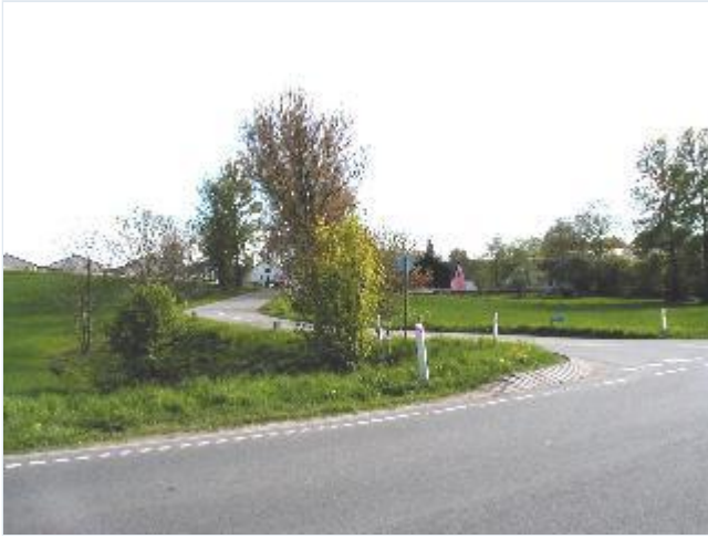
Foto: 9. Landsbyens nordøstlige del, fra nordøst