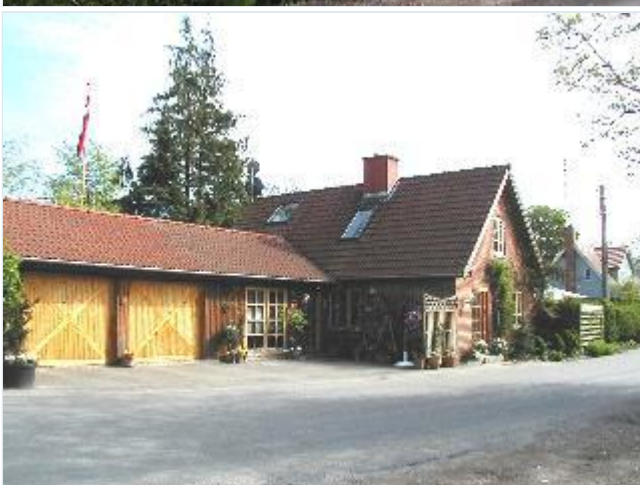
Foto: 8. Hus mellem Dyssehøjgård og den tidl. smedie på østsiden af gaden Stort billede