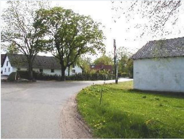
Foto: 1. Indfaldsvejen til byen fra nordøst, Guldkildegårds længe vest for og Dyssehøjgård sydøst for