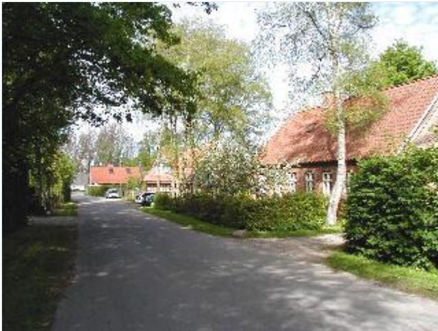
Foto: 6. Gård og tidl. smedie på østsiden af landsbygaden (Bårupvej) Stort billede