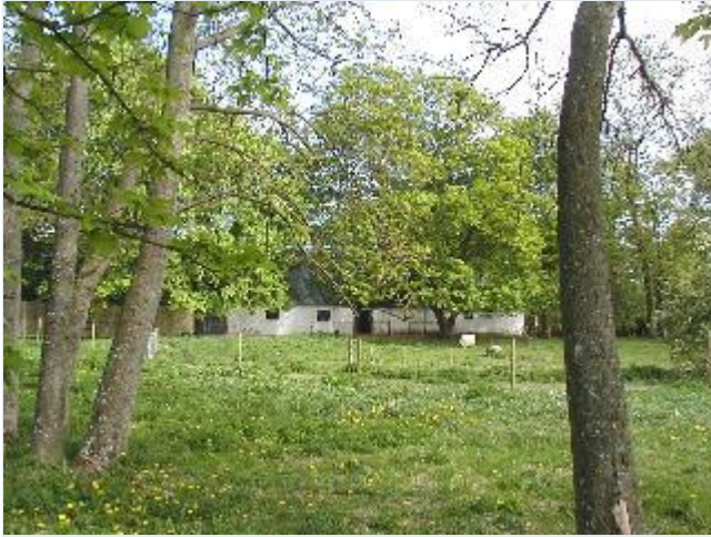
Foto: 10. Vennekrogsgårds vestlænge og toft, fra nordvest