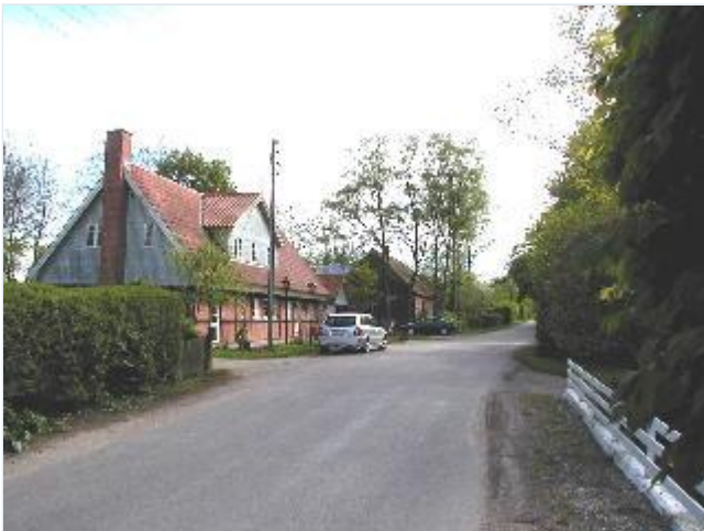
Foto: 3. Landsbygaden (Bårupvej) mod sydvest med den tidligere købmandsgård i forgrunden