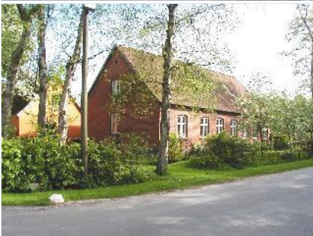
Foto: 4. Mindre gård på østsiden af gaden centralt i byen, fra nord