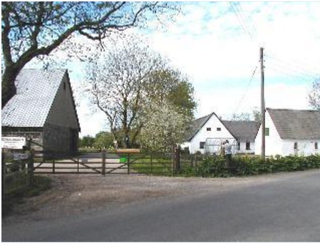
Foto: 2. Guldkildegård (til højre) og kampestenslænge til Vennekrogsgård